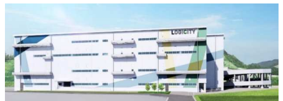
(仮称) ロジシティ古賀青柳

福岡地所は、機能性とデザイン性を兼ね備えた物流施設「ロジシティ」シリーズの開発を複数進めており、エフ・ジェイロジは、より高品質な物流拠点を確保する上で、同業他社と比較して優位性の高い物流戦略・計画の提案が可能です。